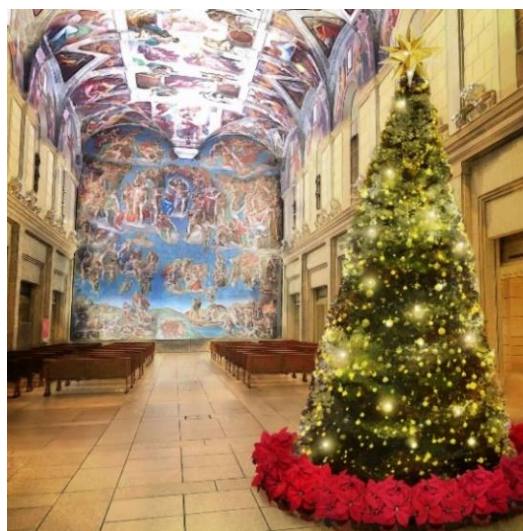
▲システーナ・ホールに輝くクリスマスツリー