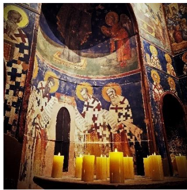
▲キャンドルの光にゆらめく 幻想的な聖堂 (地下3階「聖ニコラオス・オルファノス聖堂」)