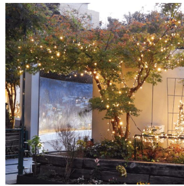
▲モネの傑作と光の共演 (地下2階 モネの「大睡蓮」)