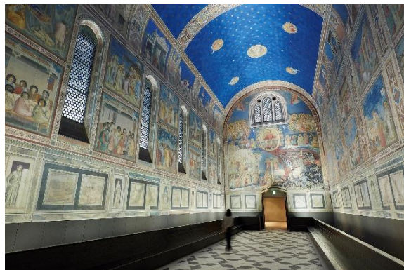
▲荘厳な雰囲気を味わえる「スクロヴェーニ禮拜堂」で 「キリストの降誕」場面を鑑賞

【期間】2021年12月1日(水)～12月25日(土) 【時間】約15分 ※開館時間中、繰り返し放映します 【場所】地下3階 センターホール