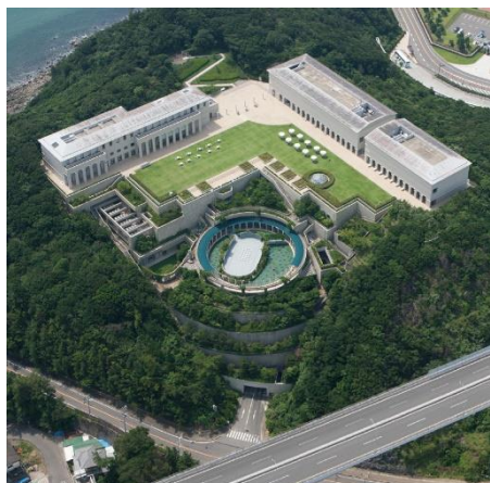
上空から見た大塚国際美術館

大塚国際美術館は自然豊かな瀬戸内海国立公園内に位置しており、景観との調和を目指し、展示室の大部分は山の中に建てられています。山上にある広大な庭園からは瀬戸内の青い海を眺めることができ、絵画鑑賞の合間に戸外で四季折々の景色を楽しむだけではなく、昆虫や鳥など自然の生き物にも出合えるおすすめの場所です。