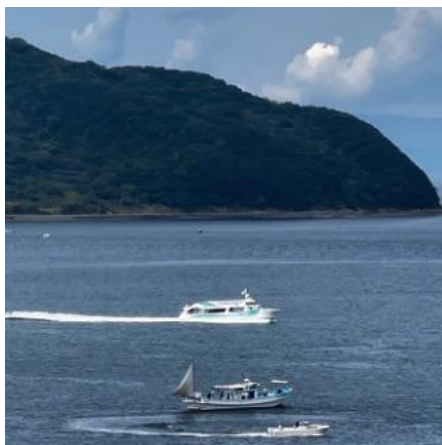
渦潮を間近で楽しめる観潮船が通ることも