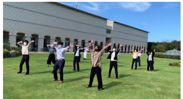
美術館スタッフも踊ります