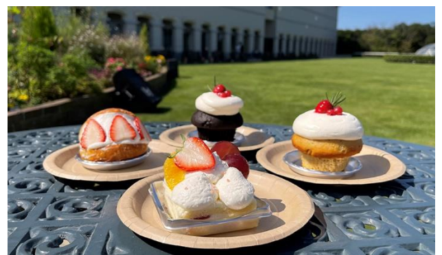
シェフのこだわりが詰まったケーキ 各種450円～