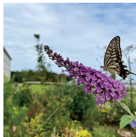
アゲハ蝶やバッタなど生き物にも出合える