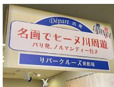
地下1階 エレベーター5・6付近

目印は、「名画でセーヌ川周遊」の看板。 床の名画への道しるべに沿って出発しよう。