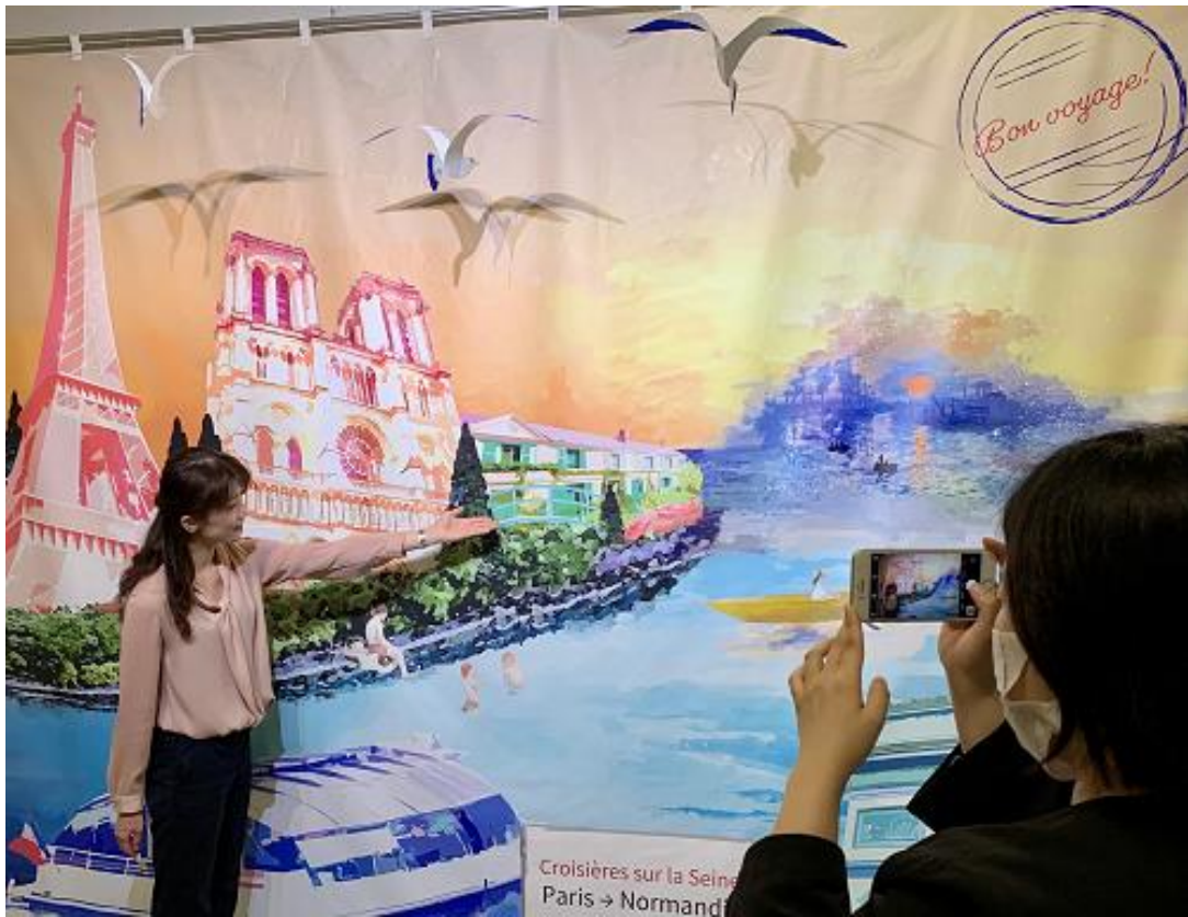
地下1階 エレベーター5・6 付近

エッフェル塔や凱旋門などパリ・セーヌ河岸の名所をデザインした当館オリジナルの絶景タペストリー。旅の思い出に、あなただけの一枚を。