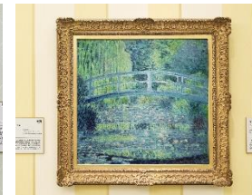
モネ 「睡蓮:緑のハーモニー」