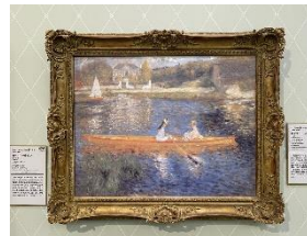
ルノワール 「セーヌ川の舟遊び」