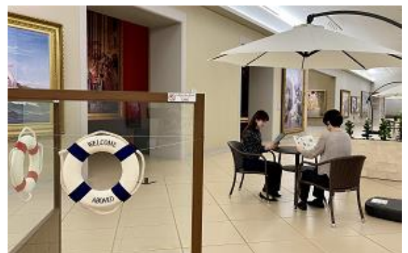
地下1階 近代展示室 78

穏やかな川を航行し、ゆったりと風景を望めるクルーズ船。デッキを思わすパラソルが並ぶ空間で、絵画鑑賞の余韻に浸りませんか。この期間のみの美しく心躍る音楽で心潤うひとときを。