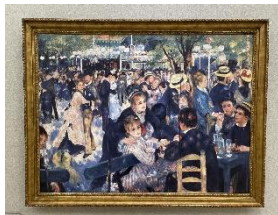
ルノワール 「ムーラン・ド・ラ・ギャレット」