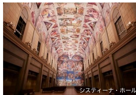
システイーナ・ホール