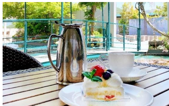
本日のスイーツセット(スイーツ1種+ドリンク1種) 900円～

セーヌ川沿いのジヴェルニーは、モネが半生を過ごし、睡蓮を描いたパリ郊外の静かな村。屋外展示：モネの「大睡蓮」に隣接するモネゆかりの地を冠したカフェ“カフェ・ド・ジヴェルニー”で、季節の花々を楽しみながら至福のTea Timeを。