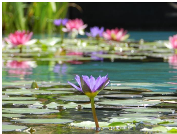
6月中旬~9月 モネが愛した睡蓮が見頃を迎える (写真は例年7月頃の様子)

※状況により、変更・休止する場合がございます ※カフェのご利用は入館料が必要です ※価格はすべて税込み