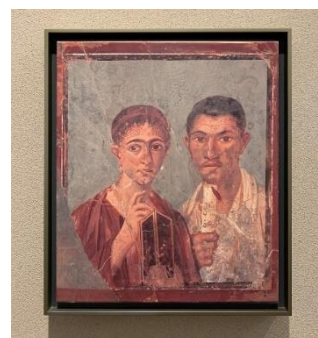
古代ローマ都市ポンペイ出土 《パン屋の夫妻》 【展示場所】地下3階古代13

また19世紀イタリアでは、3月初めの金曜日に将来を約束した女性にマリトッツォをプレゼントする風習があり、クリームの中に指輪をしのばせプロポーズをする人もいたそうです。