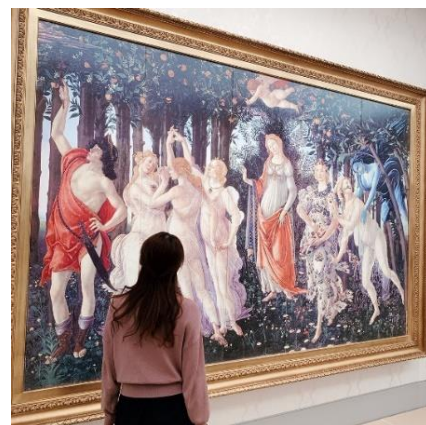
▲ボッティチェッリ「春(ラ・プリマヴェーラ)」