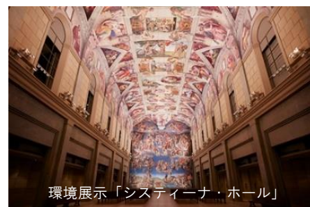
環境展示「スティーナ・ホール」