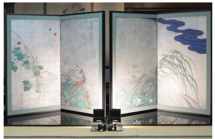
▲裏：酒井抱一「夏秋草図屏風」