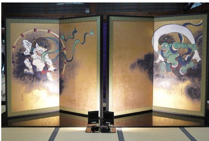
▲表：尾形光琳「風神雷神図屏風」

尾形光琳が「風神雷神図屏風」を描いたおよそ100年後、光琳を敬愛する酒井抱一が裏側に「夏秋草図屏風」を描きました。風神(右)の裏側には、風神が巻き起こす風にたなびく秋草が、雷神(左)の裏側には、雷神が降らせた雨に打たれる夏草がそれぞれ描かれ、表裏でつながりが感じられる作品です。