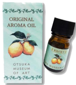
▲オリジナルアロマオイル 「果実の祈り」 1430円