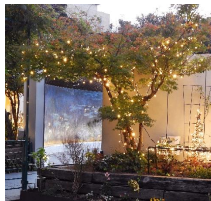
▲モネの「大睡蓮」周辺のライトアップ