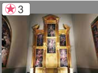
3 埃尔·格莱科的祭坛屏风复原 (环境展示)